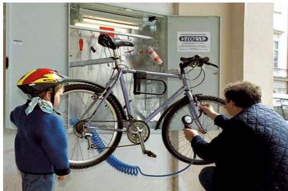
Opravná stanica pre bicykle, Salzburg, Rakúsko