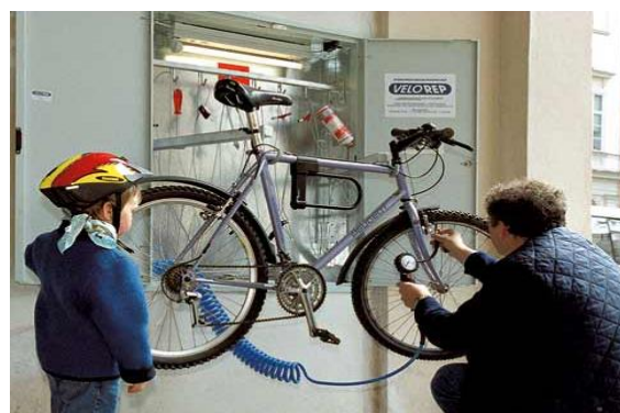
Opravna kol, Salzburg, Rakousko